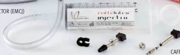
CAFFÉ TUBELESS VALVE (EMCV2)

CAFFÉ TUBELESS TAPE Reinforced with glass-fiber. CAFFÉ TUBELESS TAPE Rinforzato con fibra di vetro. CAFFÉ TUBELESS TAPE Renforcé avec fibre de verre. CAFFÉ TUBELESS TAPE Renforzado con fibras de vidrio. CAFFÉ TUBELESS TAPE Verstärkt mit Glasfaser.