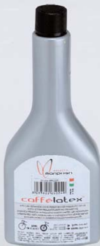
CAFFELATEX 250 ml (EMCL250)

CAFFELATEX An innovative tyre sealant and puncture preventive. Its exclusive foaming action causes it to fill the tyre internal cavity, preventing also sidewall punctures. Containing no ammonia, it is 100% tyre & rim friendly. CAFFELATEX E' un sigillante per pneumatici e preventivo di foratura innovativo. La sua esclusiva azione schiumogena gli permette di riempire la cavità interna del pneumatico e di essere molto efficace anche contro le forature sui fianchi. Non contenendo ammoniacca, è al 100% compatibile con pneumatici e cerchi. CAFFELATEX Est un étanchéisant de pneus et préventif de crevaisons innovatif. Son exclusif effet moussant lui permet de remplir l'intérieur des pneus et d'être également efficace contre les crevaisons sur les flancs. Sans ammoniac, il est 100% compatible avec pneus et jantes.