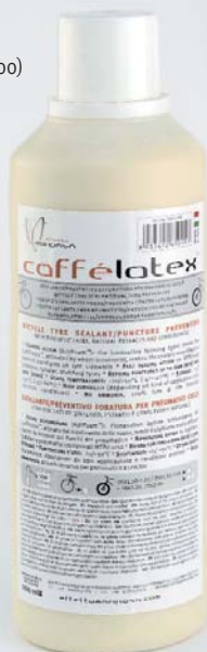
CAFFELATEX 1000 ml (EMCL1000)